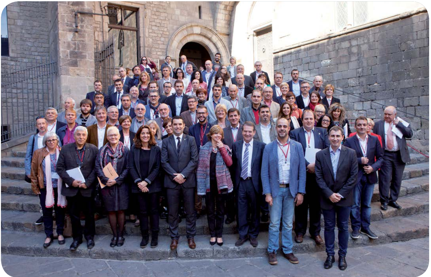
Foto de família dels electes assistents a la 26ena Assemblea General de l' FMC , a les escales del Saló del Tinell de Barcelona