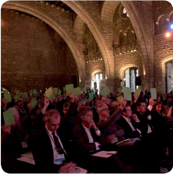
Assistents a l'Assemblea de l' FMC en el moment de la votació