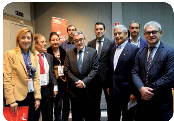
L'alcalde de Lleida, amb alguns membres del FòrumSD