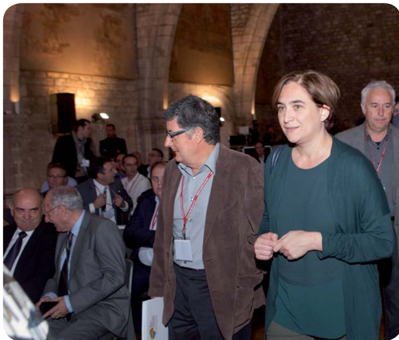
L'alcaldeessa de Barcelona, Ada Colau, arriba al Saló del Tinell per intervenir en la inauguració de l'Assemblea de l'FMC, acompanyada per Lluís Tejedor, alcalde del Prat de Llobregat

Ada Colau va concloure oferint Barcelona a la resta de municipis de Catalunya: “aquí hi teniu un aliat per defensar el municipalisme, perquè no entenem una millor manera de fer país que fer municipi”.