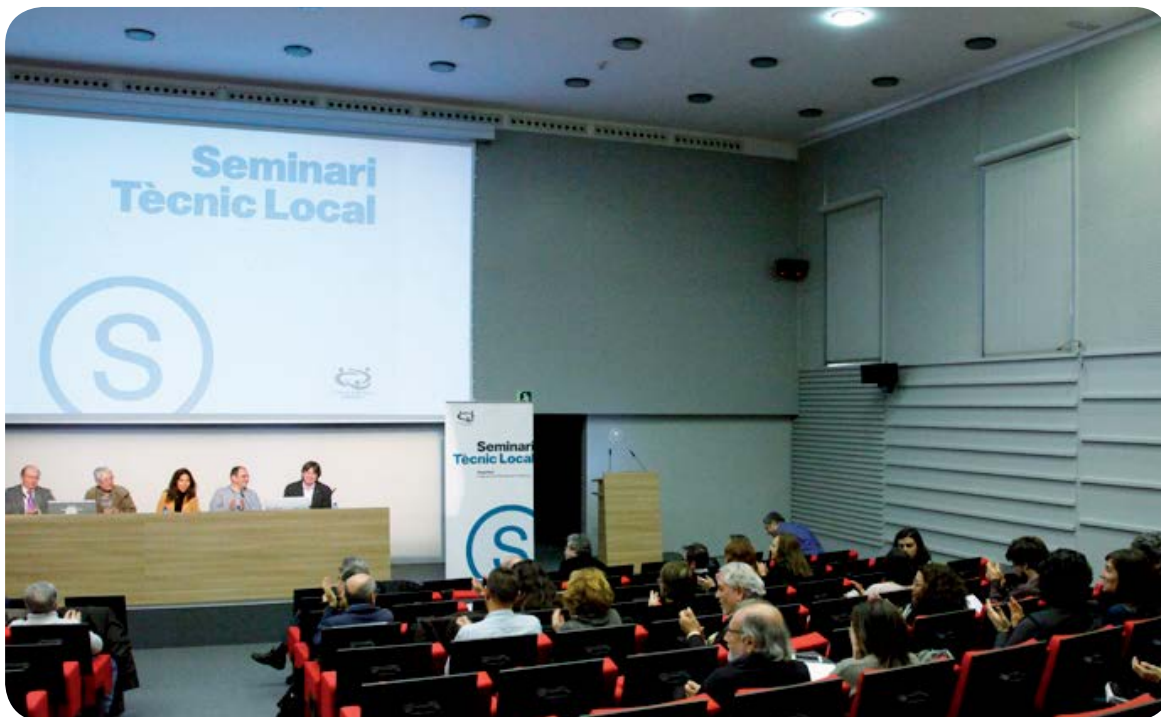
Aquesta imatge correspon a la sessió de cloenda del Seminari Tècnic Local 2015, celebrada el 18 de desembre de 2015

Ara fa 18 anys, la Federació de Municipis de Catalunya , en el marc del seu programa de formació, va crear el Seminari Tècnic Local amb l'objectiu de contribuir a la formació continuada dels tècnics d'administració local, fet que, sens dubte, possibilita una millora en la gestió dels serveis que les administracions locals presten als ciutadans.