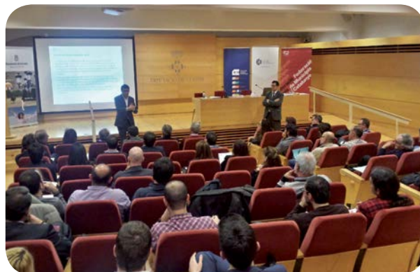
Sala on es va celebrar la sessió de Lleida el 3 de març