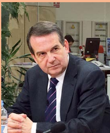
Abel Caballero, president de la Federació Espanyola de Municipis i Províncies i alcalde de Vigo

“ Quan ja han transcorregut més de trenta anys des de la primera Llei de bases de règim local, i quan només falten dos perquè la norma que regula les hisendes de les nostres entitats locals aconsegueixi aquesta curiosa edat, ha arribat el moment de fer algunes consideracions: la primera, la consolidació de l'autonomia local, un principi que la recent LRSAL ha posat en entredit; i la segona, el sosteniment financer d'aquesta autonomia, perquè bé sabem que no n'hi ha prou amb què es reconegui la nostra capacitat competencial.